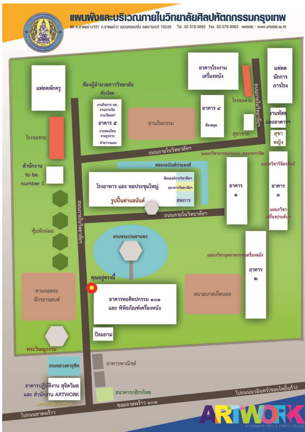
ภาพ ๓ ภาพแสดงแผนผังวิทยาลัยศิลปหัตถกรรมกรุงเทพ