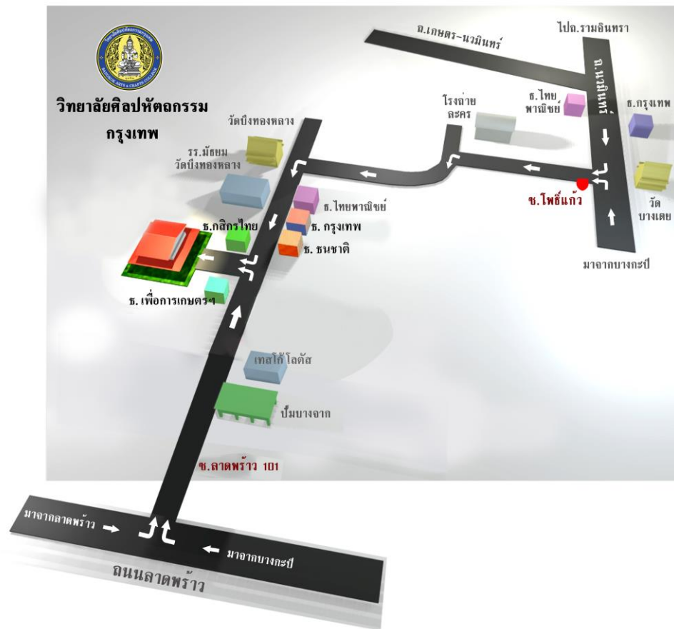
ภาพ ๑ แสดงแผนที่วิทยาลัยศิลปหัตถกรรมกรุงเทพ

อาคารเรียนในวิทยาลัยศิลปหัตถกรรมกรุงเทพ มีจำนวน ๗ หลัง ๔๗ ห้อง ประกอบด้วยห้องเรียน วิชาสามัญห้องปฏิบัติการประจำแผนกต่าง ๆ ห้องสมุด ห้อง Sound Lap และห้องศูนย์การเรียนรู้ด้วยตนเอง วิทยบริการ ห้อง Internet หอศิลปกรรม ๑๐๑ นอกจากนี้วิทยาลัยฯ ยังมีศูนย์บ่มเพาะและบริการวิชาชีพสุจริตวิมล ที่เกิดจากการร่วมคิด ร่วมทำของผู้บริหารและบุคลากรในวิทยาลัยร่วมกับกรรมการสถานศึกษา เพื่อให้เป็นแหล่งการเรียนรู้ที่สำคัญของท้องถิ่นและนักเรียน นักศึกษา